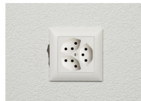
1. Der EDIZIOdue Abdeckrahmen (88 x 88 mm) deckt die unsauber montierte Einlassdose nicht vollständig ab.

Wenn grössere Einlasskasten nicht sauber installiert wurden, kann es sein, dass der EDIZIOdue Abdeckrahmen (88 x 88 mm) die Einlassdose nicht vollständig abdeckt. Im schlimmsten Fall benötigen sie gar einen Maler oder Gipser, um dies optisch zu korrigieren.