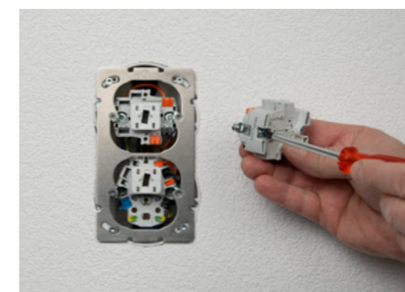
2. Sollte ein SNAPFIX® Adapter defekt sein oder ein Bajonett Stützbügel fehlen, sind die Umbau-Kits ebenfalls von grossem Vorteil.