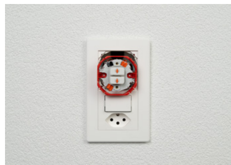
1. In dem Moment wo Spannung vorhanden ist, stellen Sie fest, dass die Storen in die falsche Richtung fahren.

Zum Zeitpunkt der Installation ist die Wohnung oder das Gebäude oftmals noch spannungslos, ebenso die Storen. Gewissheit, ob die Storen richtig angeschlossen sind, haben Sie erst, wenn Spannung vorhanden ist und Sie es testen können. Im Fehlerfall müssen die Kombinationen mit Bajonett Befestigungssystem aufwendig demontiert, neu angeschlossen und wieder montiert werden.