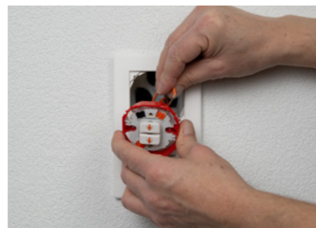
2. Dank dem SNAPFIX® Befestigungssystem demonstrieren Sie den Storeschalter von vorne durch den Abdeckrahmen und schliessen Sie ihn neu an.