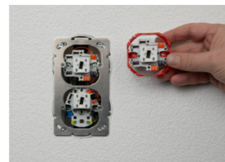
1. Dank der Umbau-Kits lassen sich Apparate für Bajonett Befestigung einfach auf SNAPFIX® Befestigung umbauen und umgekehrt.