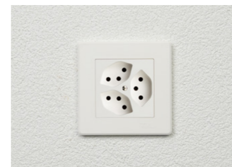
2. Mit der neuen EDIZIO.liv Designlinie (Grösse 93 x 93 mm) lösen Sie dieses Problem ganz einfach.